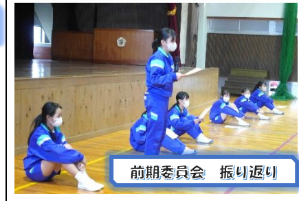
前期委員会 振り返り