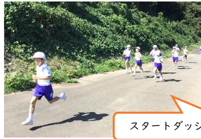
スタートダッシュ